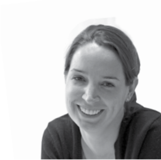
Маэль Гавэ ГЕНЕРАЛЬНЫЙ ДИРЕКТОР ХОЛДИНГА OZON.RU

Уважаемые коллеги! Раз в ваших руках оказался этот буклет, значит, вы имеете отношение к электронной торговле в Рунете, значит, мы развиваем этот рынок сегодня вместе. Мы работаем с вами в замечательной стране и в замечательное время. Замечательная страна, потому что именно в России много творческих людей, которые не боятся сложностей, не боятся рисковать. Замечательное время, потому что рынок, на котором мы работаем сейчас, растет очень высокими темпами, которые сохраняются, по нашему мнению, и в ближайшее время, ведь онлайн-покупателей становится все больше с каждым днем. И нашему молодому, но активно развивающемуся и нуждающемуся в сильной информационной поддержке рынку, было необходимо именно такое исследование, ведь РАЭК находится на острие рынка в непосредственной близости к его ключевым игрокам и имеет возможность консолидировать информацию для него, дополнять экспертными оценками, что выделяет данную работу среди других. Спасибо РАЭК и ВШЭ за исследование, надеюсь, что данная инициатива будет иметь продолжение. Как известно, в России сегодня самое большое количество интернет-пользователей в Европе, более 50 млн, и большие перспективы роста. Но есть и определенные аспекты, с которыми нам сегодня с вами нужно работать: