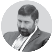
Борис Омельницкий ПРЕЗИДЕНТ IAB RUSSIA

В России каждый из крупнейших игроков имеет свои эксклюзивные площадки, аудиторию близкую по объему ко всему населению Рунета, которую продает через собственную инфраструктуру. При этом ни один из игроков не контролирует более 25% рынка дисплейной рекламы, что способствует здоровой конкуренции. Бурно развивающиеся на Западе технологии закупок в режиме реального времени с использованием социально-демогра-