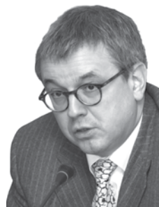
Ярослав Иванович Кузьминов

РЕКТОР НАЦИОНАЛЬНОГО ИССЛЕДОВАТЕЛЬНОГО УНИВЕРСИТЕТА «ВЫСШАЯ ШКОЛА ЭКОНОМИКИ» (НИУ ВШЭ)